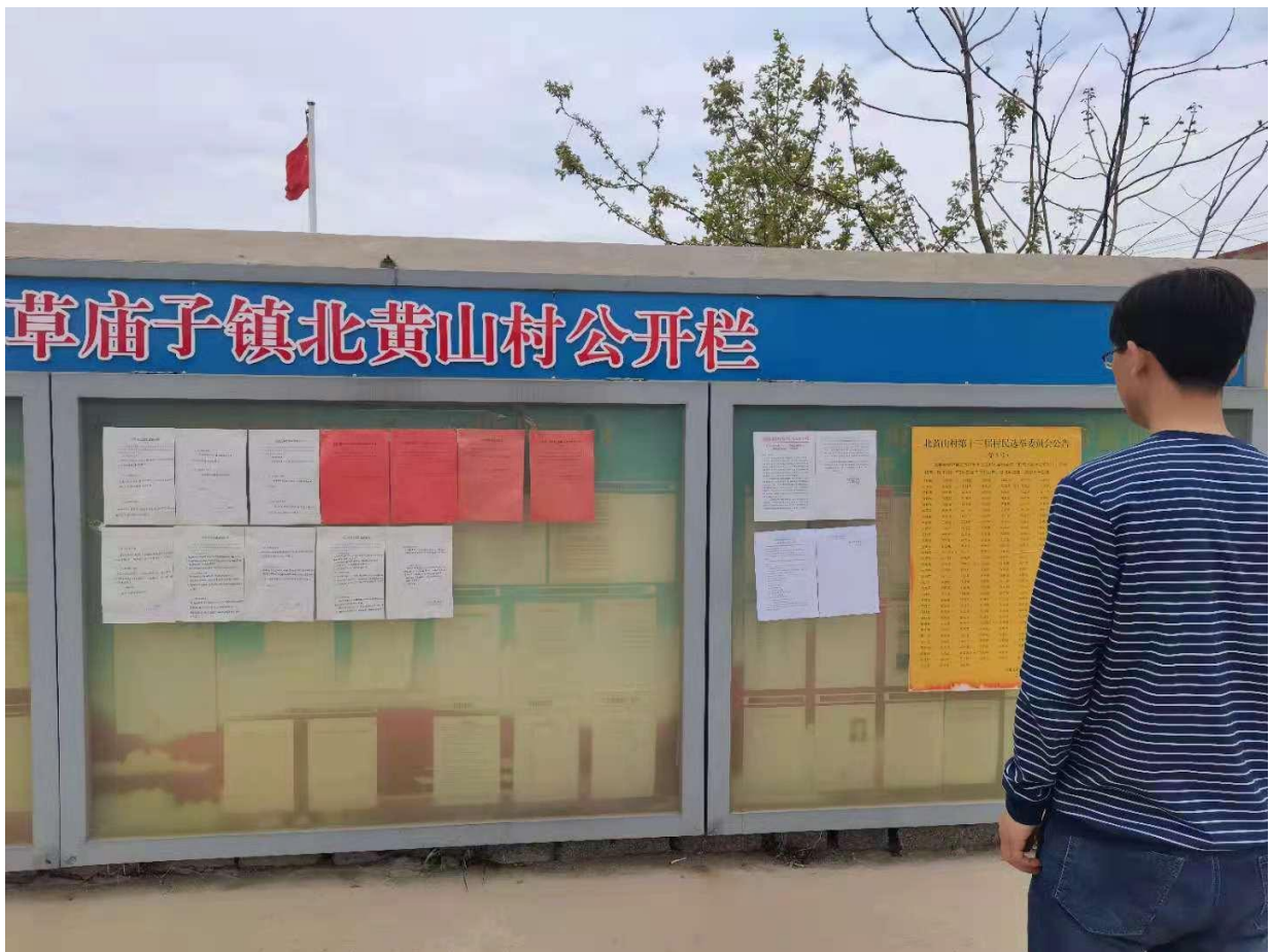
图 4 项目环境影响评价信息公开张贴公告照片